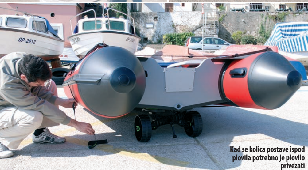
Kad se kolica postave ispod plovila potrebno je plovilo privezati