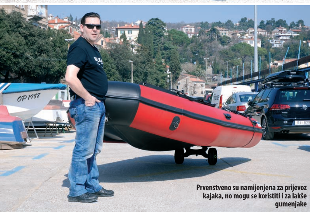
Prvenstveno su namijenjena za prijevoz kajaka, no mogu se koristiti i za lakše gumenjake

jednom trakom nismo mogli obuhvatiti plovilo trebalo je nastaviti drugu traku. S obzirom na to da gumenjak ima stotinjak kilograma, dopušteno osovinsko opterećenje C-Tuga od 120 kilograma daje još mnogo rezerve. Nakon što smo gumenjak privezali za kolica probali smo kako stvar funkcionira. Jedna osoba bez problema može podići pramac plovila i vući