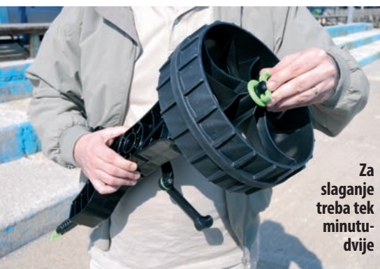
Za slaganje treba tek minutu-dvije